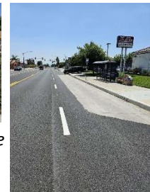
Rampa de Autobus

APRENDA MÁS EN LÍNEA, VISITE: yourrialto.com/RiversideAveCentral