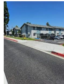
Entrada de la calzada