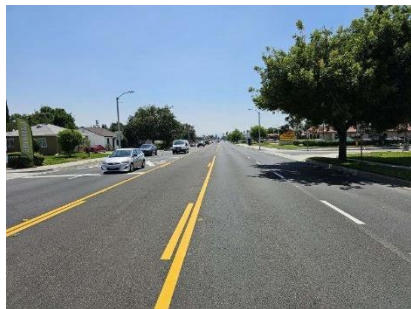
Redelineación final en Riverside Ave.

Se redelinearon 6,750 pies lineales o 1.28 millas en Riverside Ave.