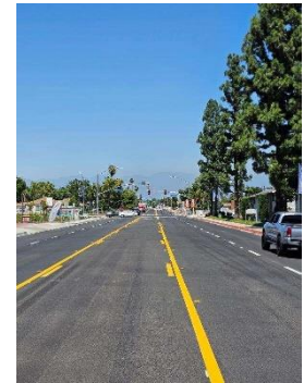
Pavimentación completada en Riverside Ave.