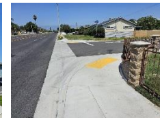
Rampas y canales de la calzada