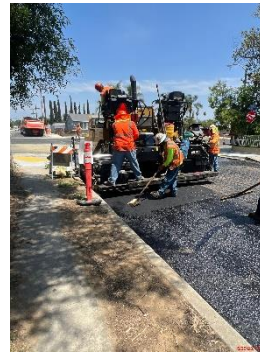
Trabajadores pavimentando el concreto asfaltico.