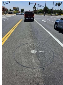
Detectores de tráfico en Merrill Ave.