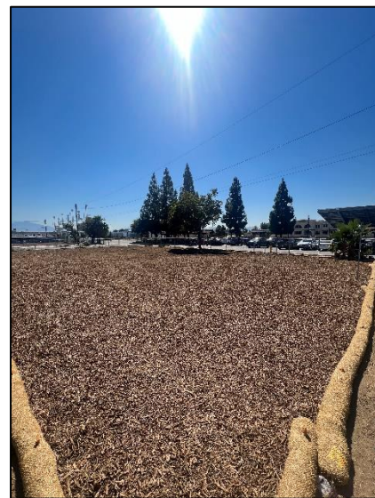
Sitio de construcción posterior