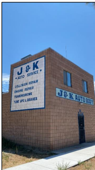
Sitio previo de construcción